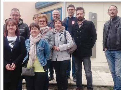
Une partie des grévistes hier devant la direction de la Poste à Nîmes. JFM

● (1) Cette grève a concerné les guichets de la Poste de Calvisson, Aubais, Caverivert, Clarensac, Congénies, Langlade, Sommières, Milhau, Aigues-Vives, Aubard, Bernis, Codognon, Mus, Ubard et Vergèze.